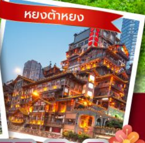
หยงต้าหยง