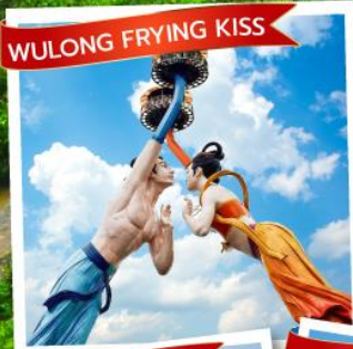
WULONG FRYING KISS